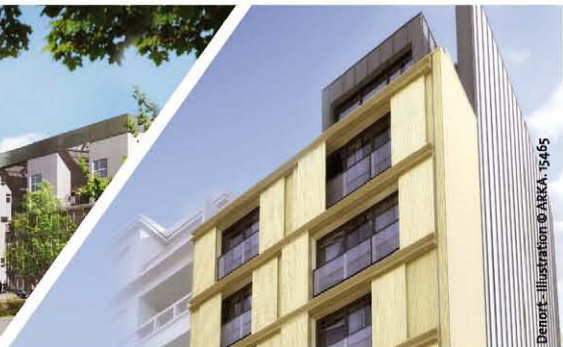
Le Duplex / Rennes