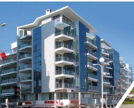
Les Terrasses des Villas La Baule Grand Prix Régional 2006

Un acteur de proximité en immobilier d'habitation et d'entreprise reconnu. Une expertise environnementale engagée.