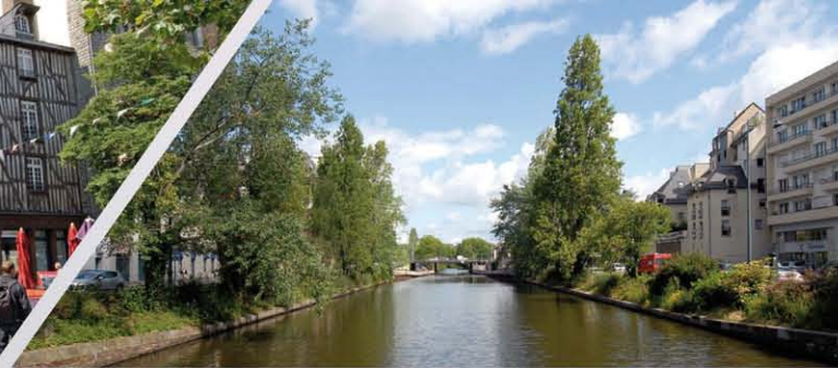
► Bord de Vilaine