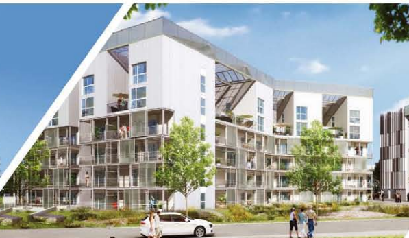
Energis / Rennes