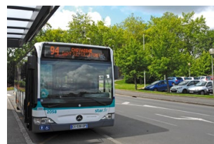
→ Les transports