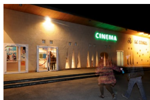
→ Le cinéma