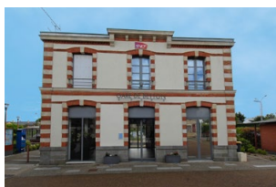
→ La gare