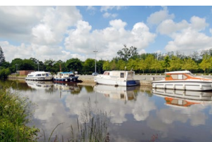
→ Le canal