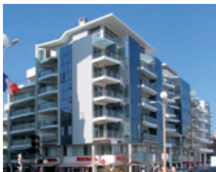
LES TERRASSES DES VILLAS - La Baule

Un acteur de proximité en immobilier d'habitation et d'entreprise. Une expertise environnementale engagée.