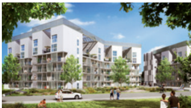
ENERGIS - Rennes