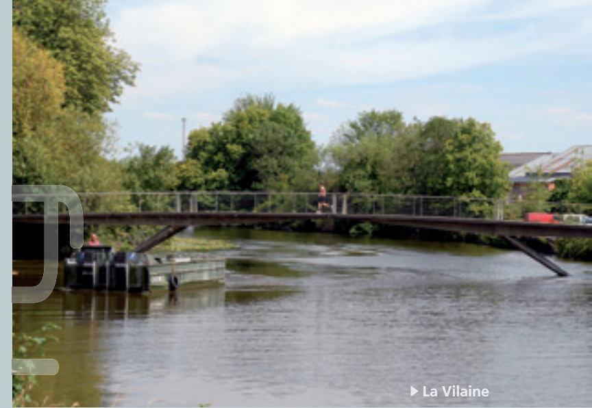
► La Vilaine