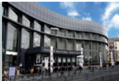
► Théâtre National de Bretagne