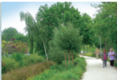
► Promenade des Bonnets Rouges

À la lisière du centre-ville, dans le très agréable et résidentiel quartier Alphonse Guérin, le TWENTY fait remarquer son élégante silhouette au milieu de maisons particulières, en angle de l'allée Georges Palante.