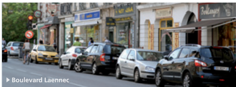
► Boulevard Laennec

Une adresse idéale pour vivre au calme, en profitant de toutes les commodités !