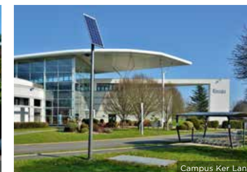
Campus Ker Lann