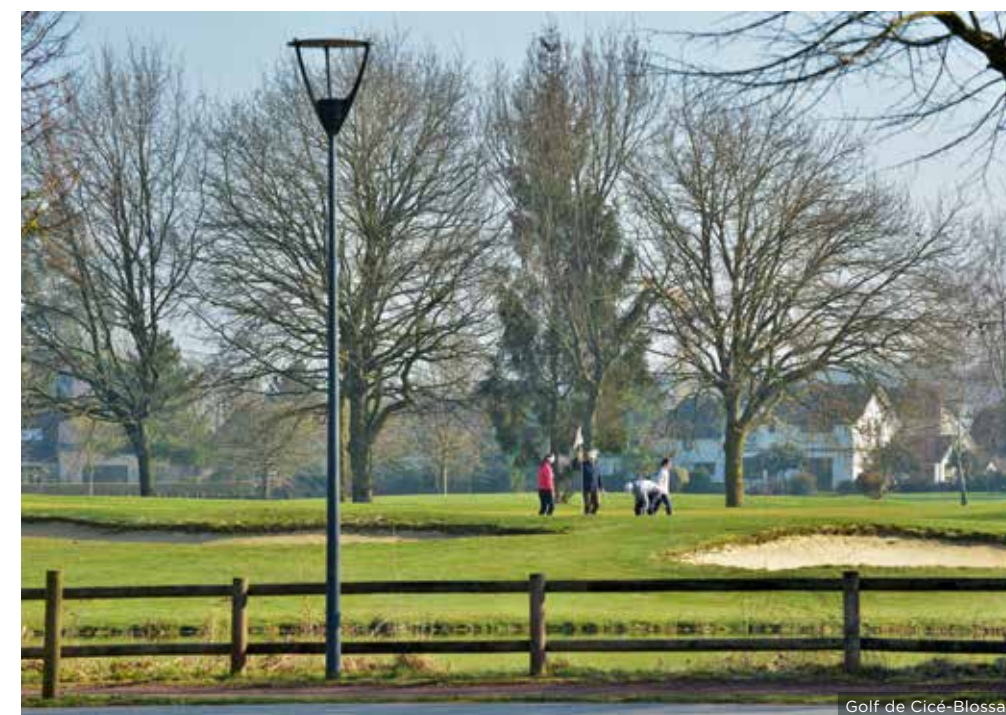
Golf de Cicé-Blossac

« Le marché du vendredi matin est l'un des plus importants du département avec ses 130 commerçants. Le mardi après-midi, se tient un marché bio de producteurs et éleveurs locaux. »