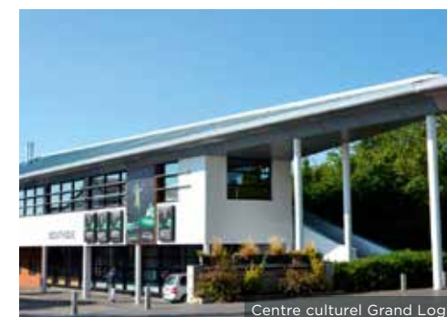
Centre culturel Grand Logis