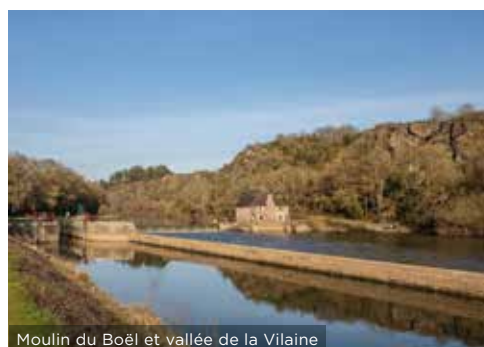
Moulin du Boël et vallée de la Vilaine