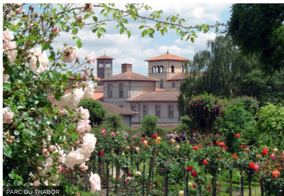
PARC DU THABOR